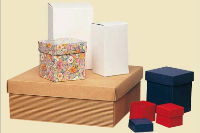
Formazione di scatole ed astucci di cartone