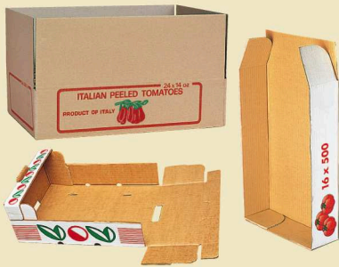
Chiusura di scatole di cartone, formazione di vassoi e plateau